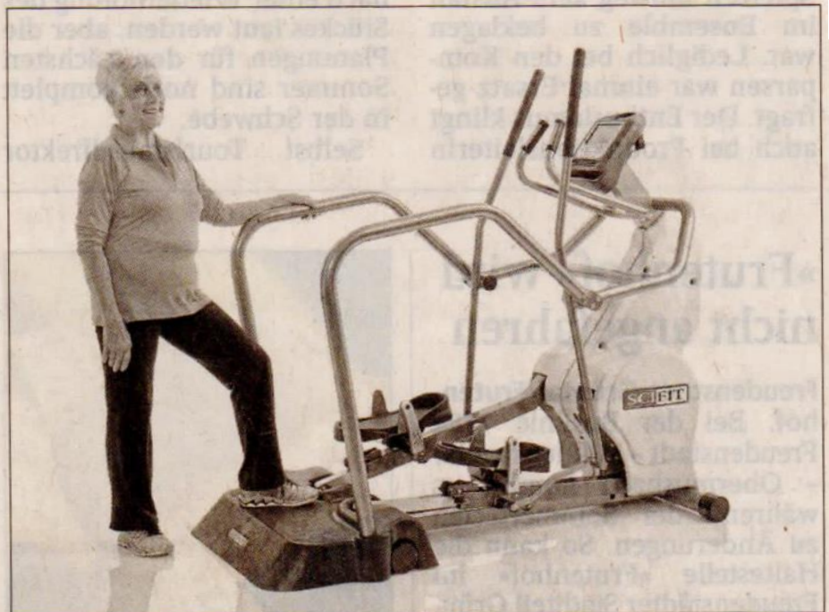
Die Trainingsgeräte sind für Senioren geeignet.