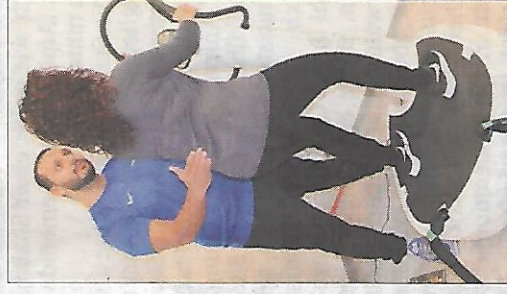
Auf der Vibrationsplattform »Power-Plate« lassen sich neben Bauch, Beinen und Po auch die Rückenmuskeln trainieren.

Wer sich Räumlichkeiten und Geräte anschauen möchte, der kann, so Denis Demirovski, jederzeit im »Zentrum Mensch« vorbeischaun.